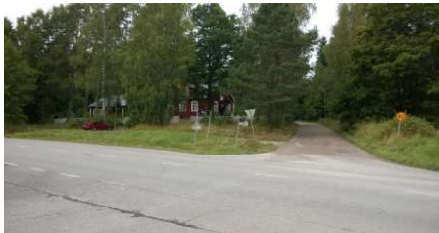
Hvittorpintie ja entinen Nissnikun ruotsinkielinen alakoulu. Kesä 2015.

Soltorpin rakennukselta Sepänkylän suuntaan kuljettaessa tien oikealla puolella erkanee Hvittorpintie . Risteyksessä sijaitsee vanha Nissnikun ruotsinkielinen alakoulu . Talo on rakennettu vuonna 1927 ja edustaa tyyliltään 1920-luvun klassismia voimakkaasti korostetuin oven- ja ikkunapielineen sekä pilasterinurkkineen. Tässä pitkälti alkuperäisen ulkoasunsa säilyttäneen talon tiloissa toimii nykyään hoitokoti.