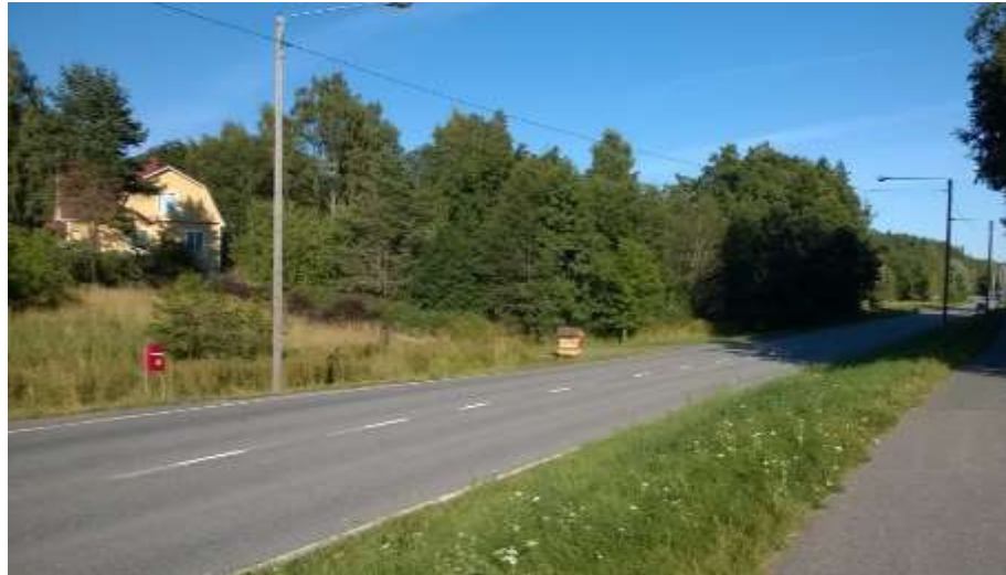
Soltorp vuonna 2015 kesällä.