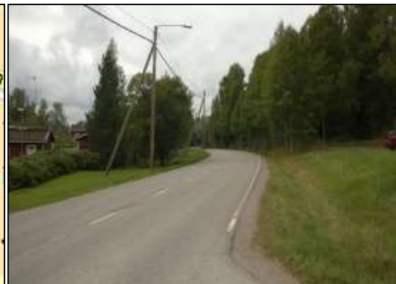
Sepänkyläntien näkymää kesällä 2015.