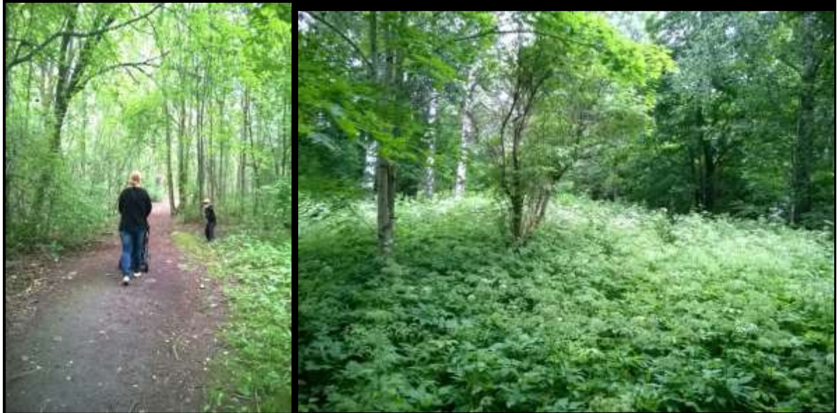
Hulluksen sekametsän polkuja ja kasvillisuutta kesällä 2015.

Hulluksen metsästä löytyy monia polkuja, jotka vievät alas Nissnikun ja Hulluksen asuinalueille sekä pohjoisemmassa Sepänkyläntielle ja siellä sijaitseville asuinalueille.