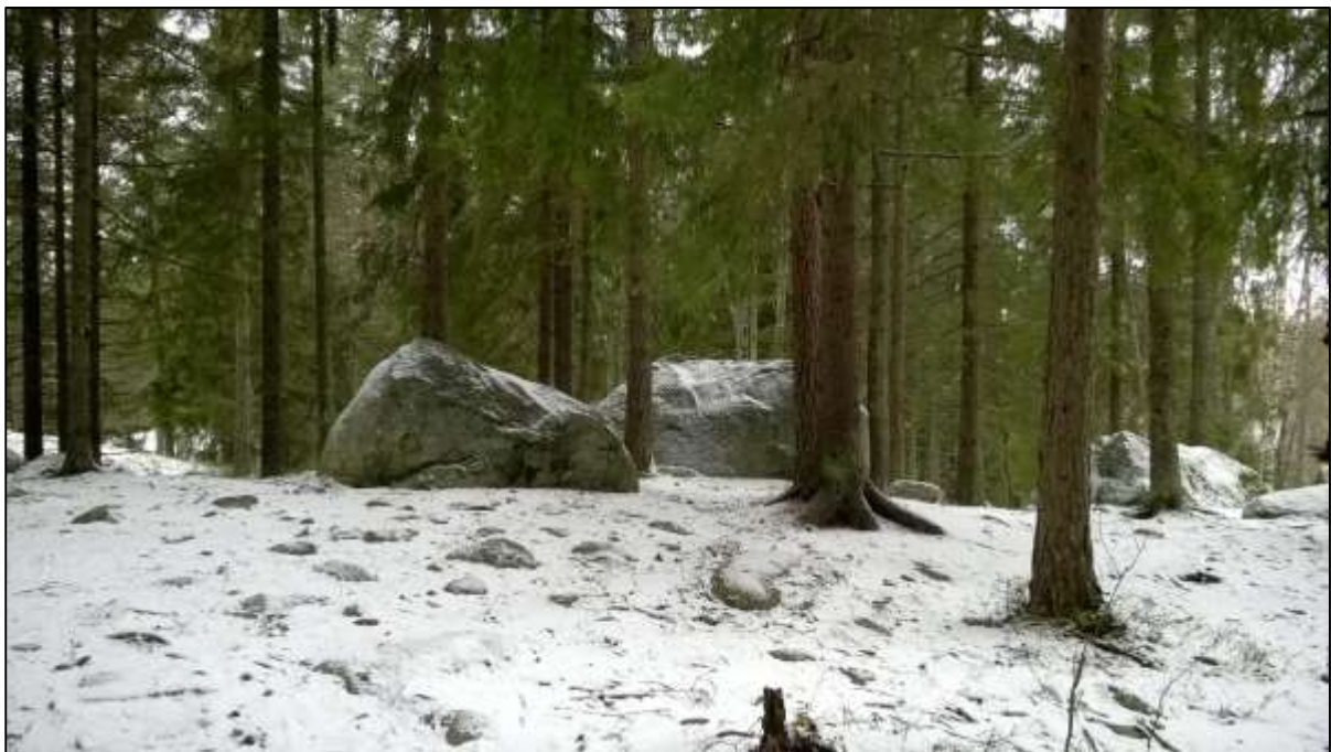
Hulluksen metsää lähellä Nissnikun asuinalueita ja Sepänkyläntietä. Talvi 2014 - 2015.