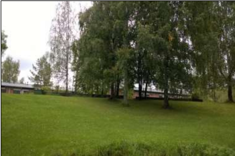
Framnäs in tilan navetan kivijalka. Kesä 2015

1540 – luvulla nimi kirjoitettiin muodossa "Hulloszby"/"Hullandszby", mutta vuoden 1560 maakirjassa käytetään nimiä "Huttlus" ja "Hullus". 1500-luvulla tilalle on merkitty kuuluvan kaksi hevosta, ja hevoset ja ratsumiehet ovat hallinneetkin tilan historiaa vuosisatojen ajan.