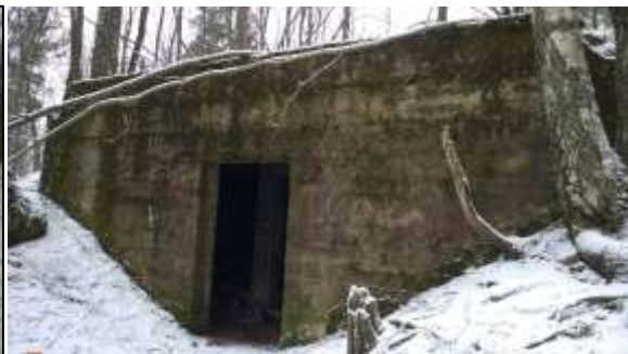
Bunkkeri Hulluksen metsässä. Talvi 2014–2015. Bunkkerissa on monta huonetta.

Hulluksen metsässä Inkilään ja Sepänkyläntien suuntaan liikuttaessa voi havaita lisää vanhoja sotilaallisia kohteita – taistelu/juoksuautoja, bunkkereita ja taistelukaivantoja. Inventoinnin lisäksi Kirkkonummen kunta ja suunnistusseura Lynx ovat kartoittaneet tarkemmin kohteiden sijainteja, ne löytyvät täältä: https://drive.google.com/file/d/0B7Xo3ct5L10QbW5na2xiaFo5ZmM/view?pli=1