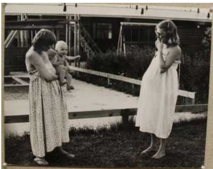
Äitejä taloyhtiön pihalla 1980-luvun Framnäsissä. Kuva Raimo Poutanen. Kirkkonummen