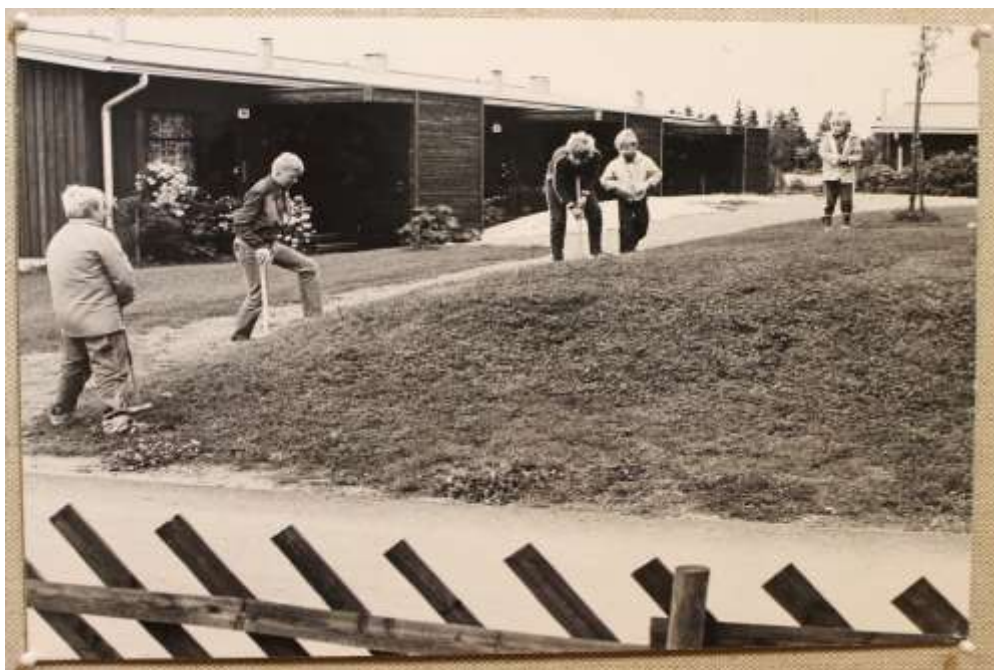
Kuvassa 1980-luvun lapsia pelaamassa krokettia Framnäsintie 3:ssa.

Raimo Poutanen on lahjoittanut kunnan kulttuuritoimelle musta-valkoisia kuvia Masalasta. Kuvat on otettu 1980-luvulla, ne kertovat meille modernin Masalan kasvusta.