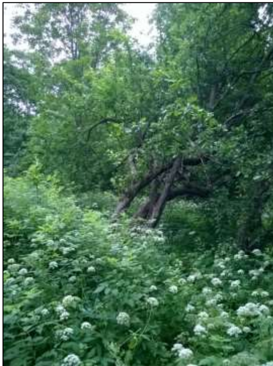
Framnäsin tilan pihan villiintynyttä puutarhaa. Kesä 2015.